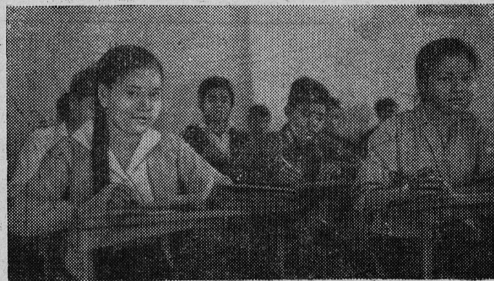
ЛАОС. Будущие учителя на занятиях.