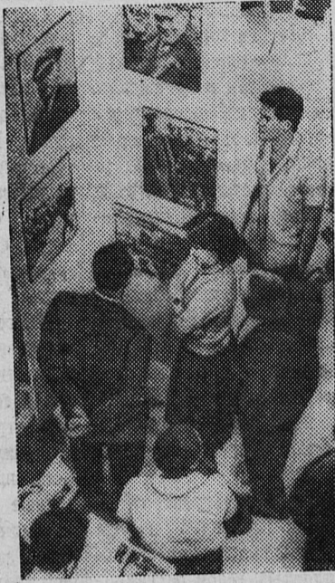
В СТОЛИЦЕ Республики Куба Гаване открыта выставка о Владимире Ильиче Ленине. В выставочном зале на площади Революции имени Хосе Марти экспонируются многочисленные фотодокументы и репродукции картин советских художников об Ильиче, труды В. И. Ленина, изданные на русском, испанском и других языках.