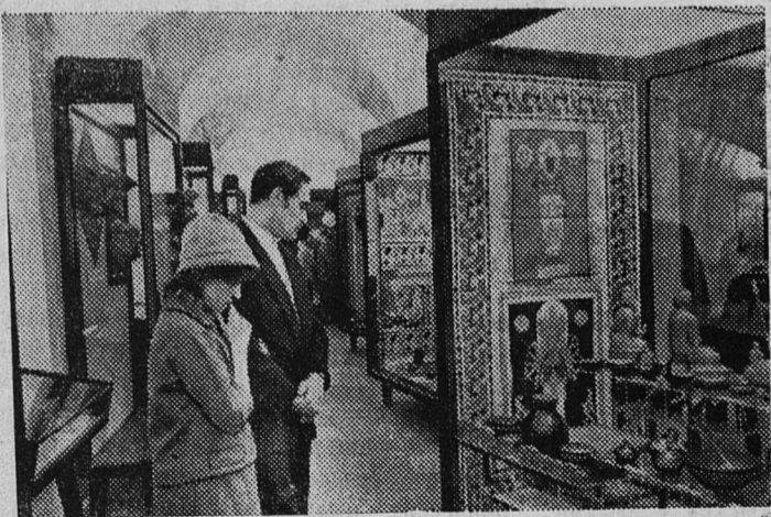
Ленинград. В музее антропологии и этнографии открыта выставка «Искусство Цейлона», организованная департаментом культуры Цейлона и институтом этнографии Академии наук СССР. На ней представлено свыше 700 экспонатов. Среди них изделия из серебра, латуни, слоновой кости, ценных пород дерева, бытовая и декоративная керамика, ткани ручной работы. Экспонаты дают яркое представление о многообразии искусства и художественных ремесел народов Цейлона. На снимке: на выставке.