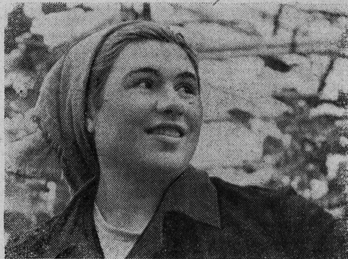
КАЗАНЬ. На 3 месяца раньше срока выполнили годовой план по производству овощей работники Казанского теплично-парниково-вого комбината.