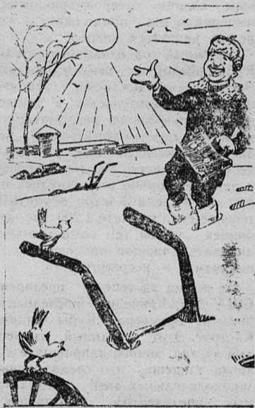
Таит снежок — вылезает плужок.

ведь это государственное имущество. Почему бы машину не попытаться отремонтировать и пустить в работу, а если это невозможно, то почему бы ее не убрать под навес, а потом использовать части?