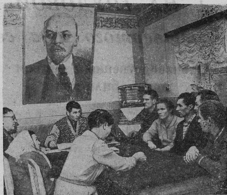
КИРГИЗСКАЯ ССР. Колхозники сельхозартели «Новый путь» Иссик-Кульского района борются за звание хозяйства коммунистического труда. Этот колхоз ставился в пример на совещании работников сельского хозяйства в Ташкенте. По производству мяса он достиг уровня, намеченного на последний год семилетки. В 1961 году на каждые сто гектаров пашни произведено по 90,4 центнера мяса в убойном весе и на сто гектаров других угодий — по 20,7 центнера. НА СНИМКЕ: колхозники, изучая решения XXII съезда КПСС, намечают новые рубежи развития всех отраслей своего хозяйства.