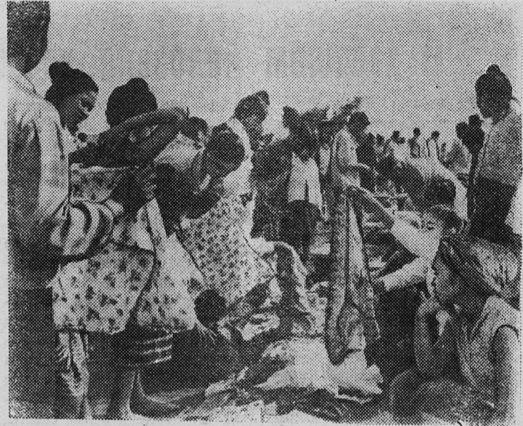
Лаос. На базаре в Сиенг-Куанге.