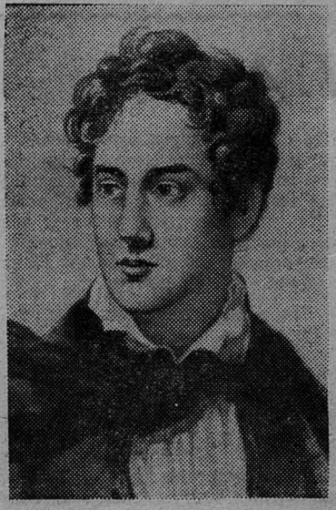
этого виднейшего представителя революционного романтизма, чье творчество всегда было ненавистно банкирам и торгашам и горячо любимо всеми, кому дороги идеалы свободы, широко отмечается в нашей стране. (ЛенТАСС)

Дело подлежит рассмотрению в Сланцевском городском народном суде.