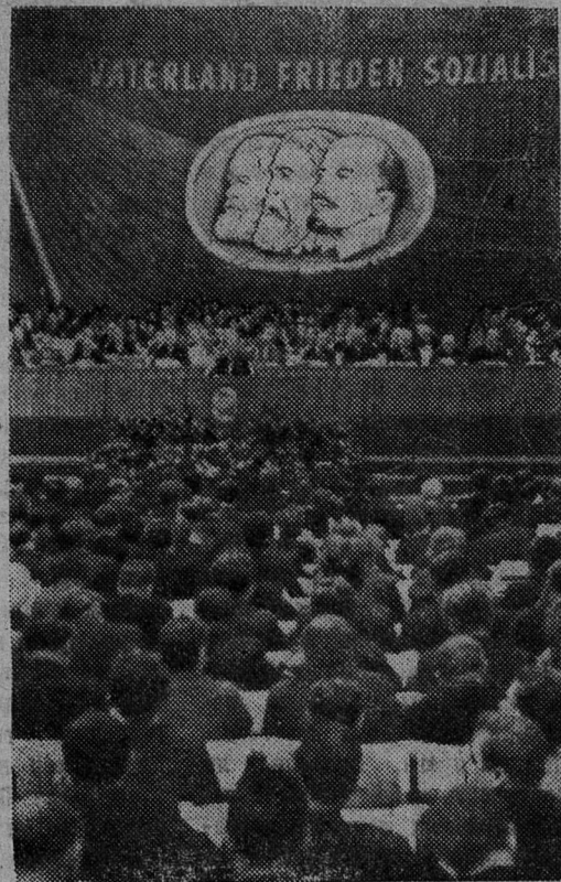
Берлин. VI съезд Социалистической единой партии Германии.

Продолжается расширение предприятий Амвросиевского цементного комбината. Здесь начало сооружение сверхмощной вращающейся печи длиной 185 метров. Предусмотрено построить еще одну такой агрегат. Вместе они будут давать свыше миллиона тонн цемента в год — столько, сколько вырабатывает сейчас весь завод с шестью агрегатами.