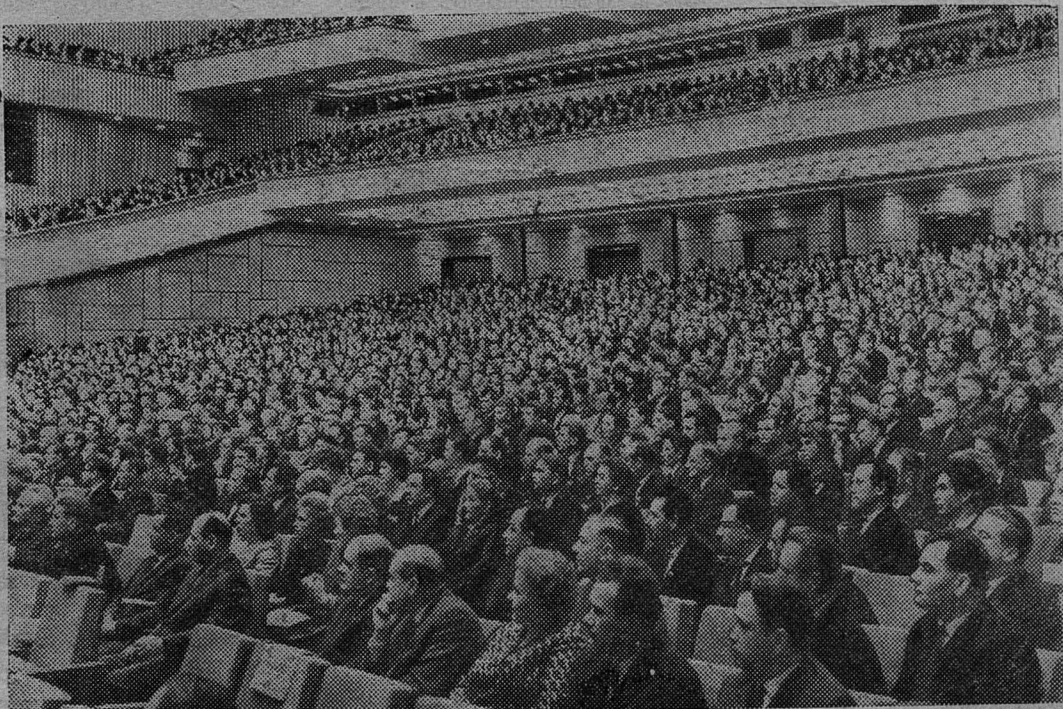
В зале Дворца съездов во время заседания.