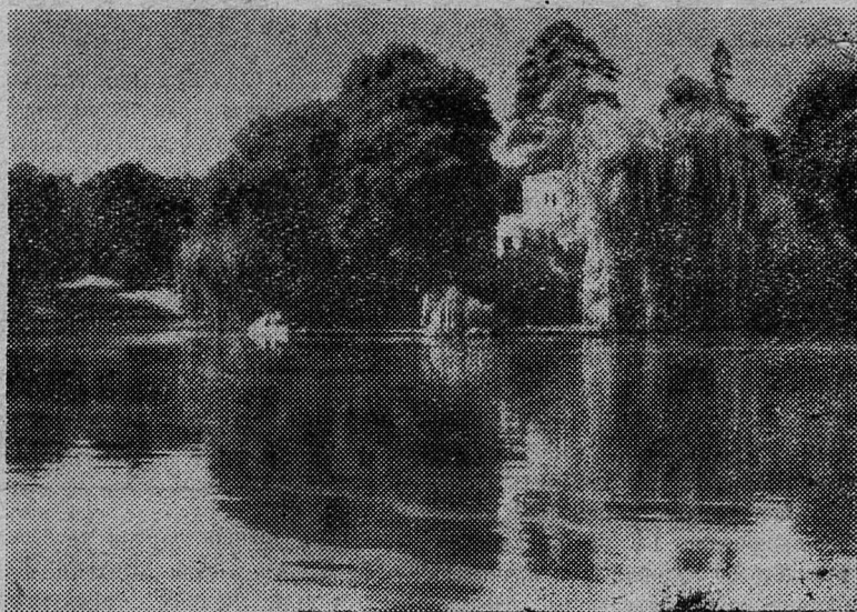
Осень на Плюссе.