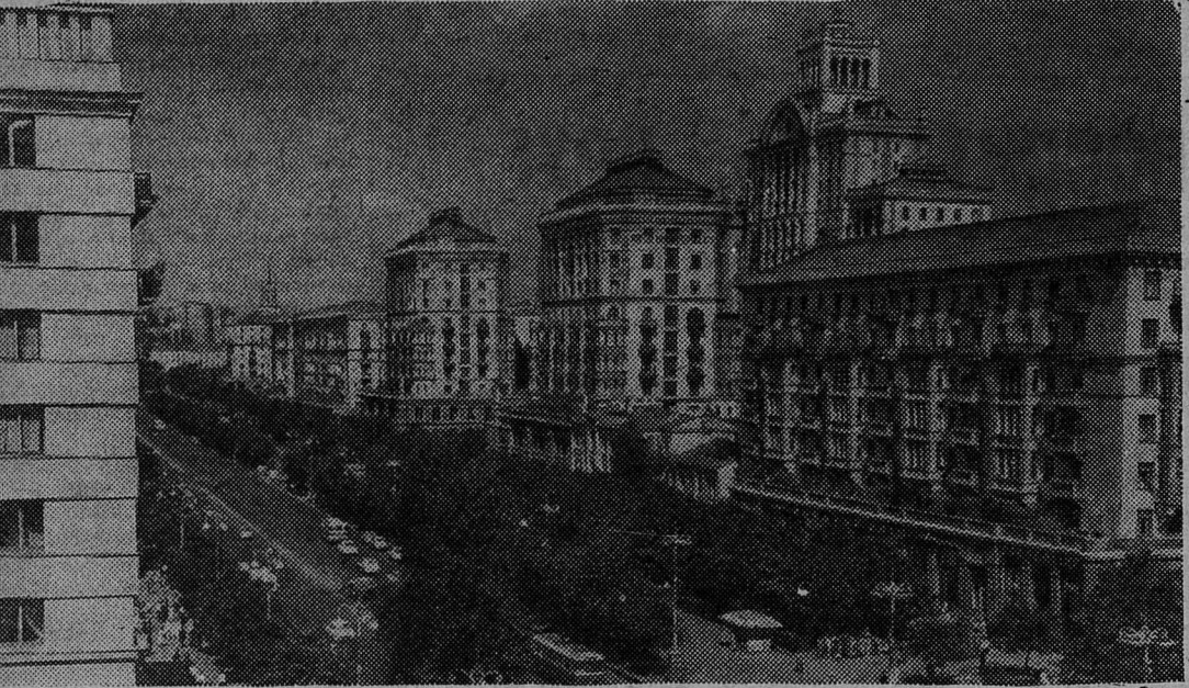
Сегодня исполняется 20 лет со дня освобождения (1943 г.) Киева частями Советской Армии от гитлеровских захватчиков.