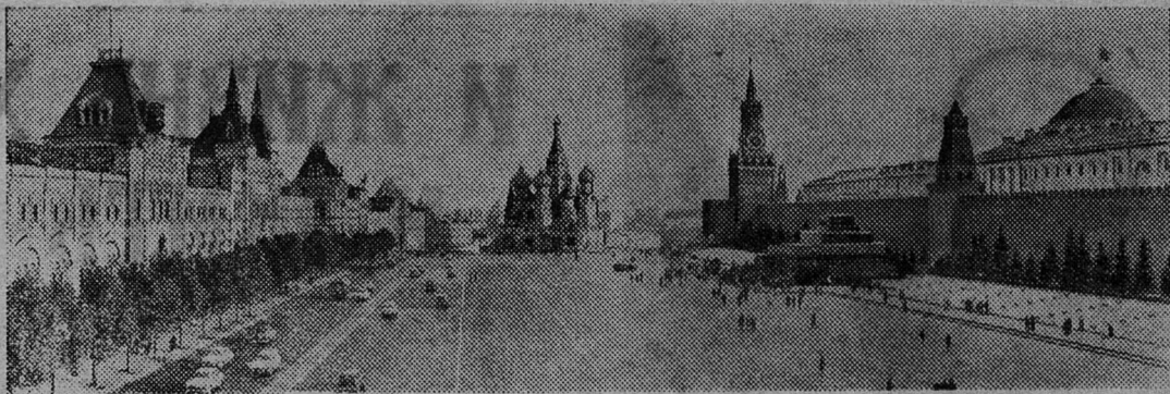
Москва предпраздничная. Красная площадь.

(Из Призывов ЦН КПСС к 46-й годовщине Великой Октябрьской социалистической революции).