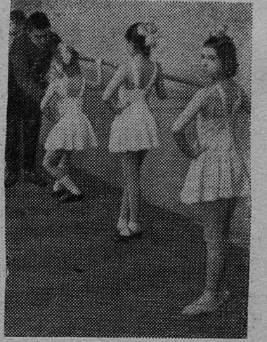
Ленинград. На занятиях в младшей группе хореографического кружка Дворца пионеров имени А. А. Жданова.