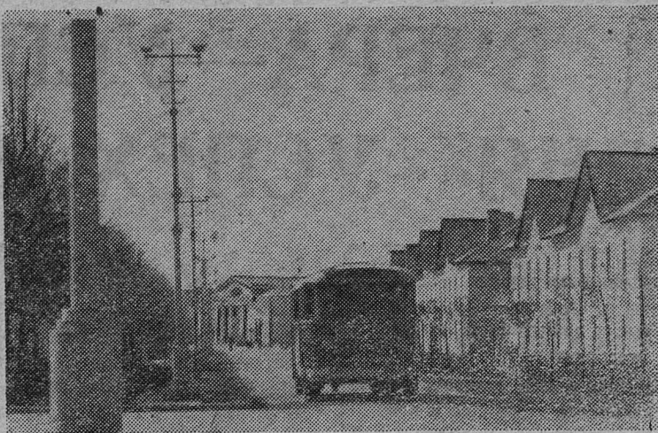
Сланцы. Улица Свободы.