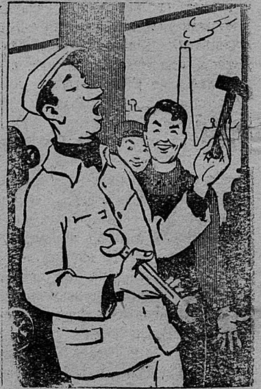
— Опыт дедов и отцов. Гвозди, молоток возьмите И носилки сколотите.