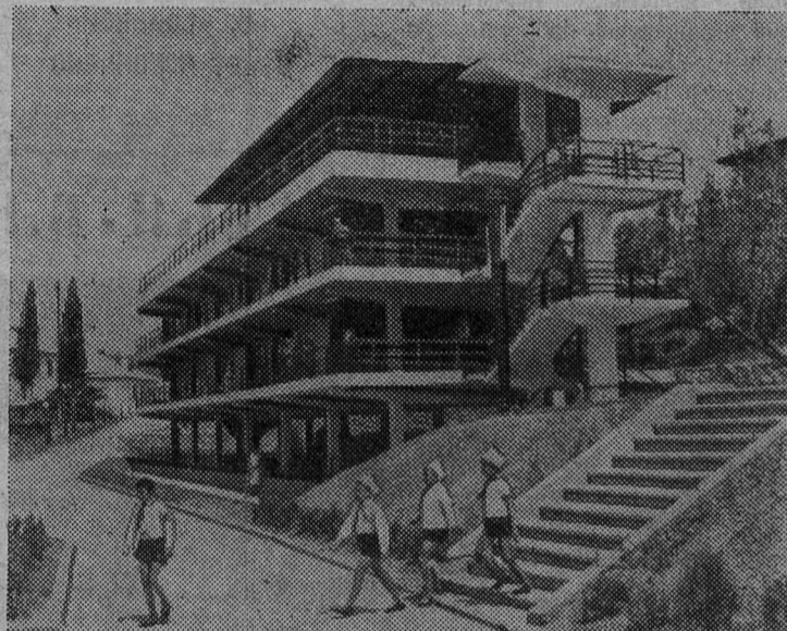
В Алуште закончено сооружение первой очереди пионерского лагеря «Наснад». Сюда приехало более двухсот детей строителей электростанций из Днепродзержинска, Канева, Запорожья. В трех светлых корпусах разместились спальные комнаты, столовая, библиотека, пионерская комната.