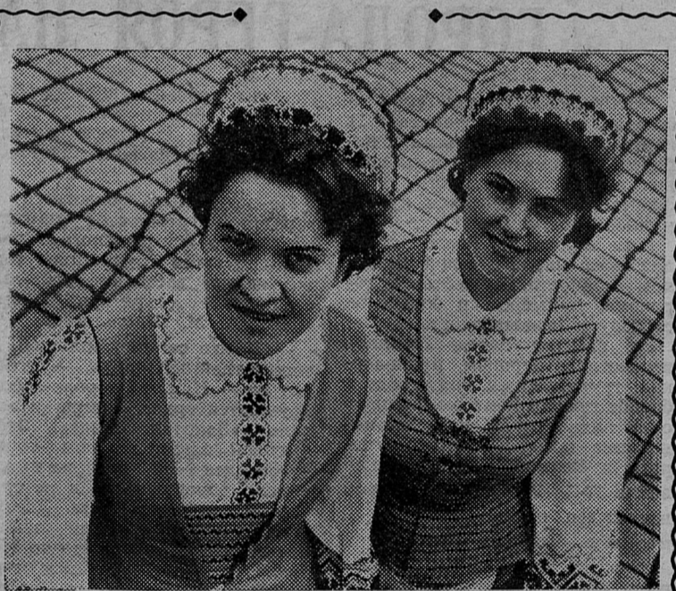
Каунасский комбинат «Искусство» — одно из самых крупных предприятий Литвы, выпускающих изделия из керамики, текстиля и дерева.

К 25-летию республики предприятие изготовило большое количество сувениров, а художники комбината — эскизы. Эти девушки одеты в национальные костюмы, созданные по эскизам комбината «Искусство».