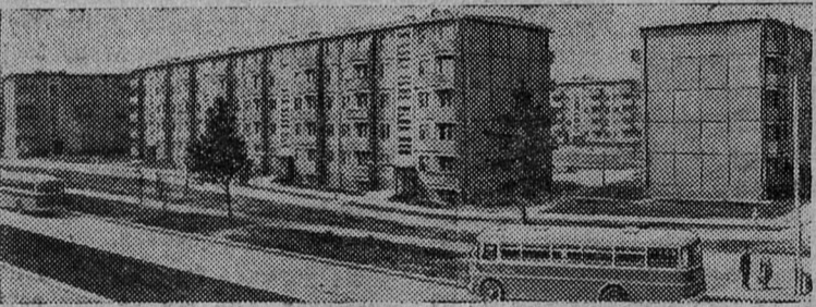
Жилые дома в новом районе Таллина — Мустамяэ. Сейчас здесь живет уже более 10 тысяч таллинцев.

Показанные отрывки войдут в репертуар драмколлектива и их смогут увидеть многие зрители. Л. НАУМОВА.