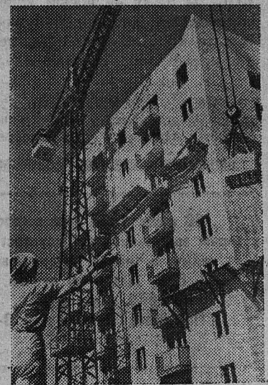
Татарская АССР. На берегу Камы растет город энергетиков и химиков Нижнекамск — крупнейшая новостройка республики.

В соревнованиях юных моряков Ленинградской области сланцевские ребята заняли первое место.