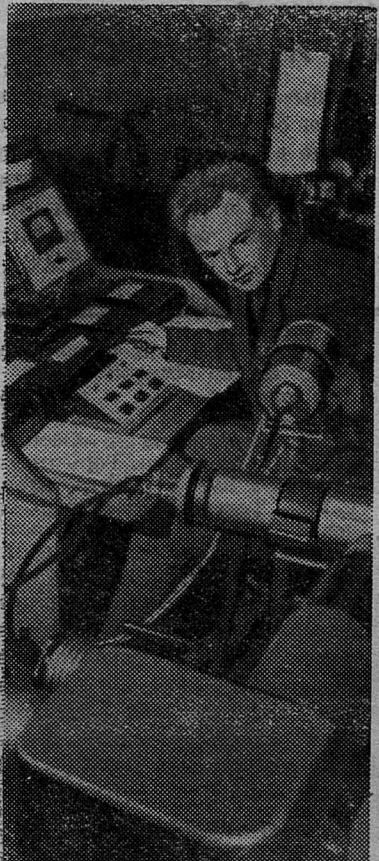
ЗАКАРПАТСКАЯ ОБЛАСТЬ. Уни- верситет создан при Советской власти. Его кабинеты и лабора- тории оборудованы новейшей ап- паратурой. Здесь 9 факультетов, 51 кафедра.

За двадцать лет университет подготовил 5.850 высококвалифицированных специалистов.