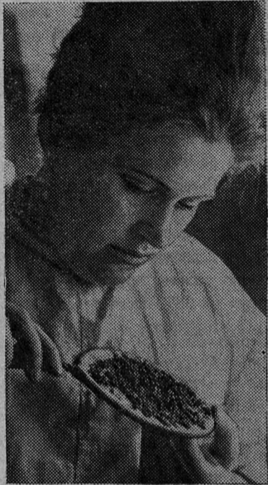
В Ростовской области созданы крупные рыбоводческие хозяйства. Одно из них — Рогожский осетровый завод. Здесь в специальных бассейнах подращивают личинки осетровых, а затем молодь высаживают в пруды. На предприятии 20 прудов общей площадью 40 тысяч квадратных метров. Ежегодно из этих прудов выпускают в Дон и Таганрогский залив около трех миллионов штук осетровой молоди.

После торжественного собрания состоялся большой спортивный праздник.