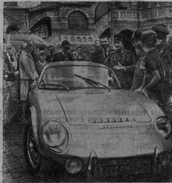
МОСКВА. На проходившем в Париже международном авиационном салоне фирма «Матра» подарила спортивную машину первому в мире космонавту Ю. А. Гагарину.