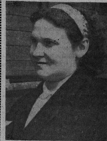
На железнодорожном транспорте нет второстепенных профессий. Здесь каждый человек на посту, и от его работы зависит и безопасность движения, и своевременная доставка грузов.

Главной причиной разногласий являются предстоящие выборы в парламент и вопросы дальнейшего конституционного устройства.