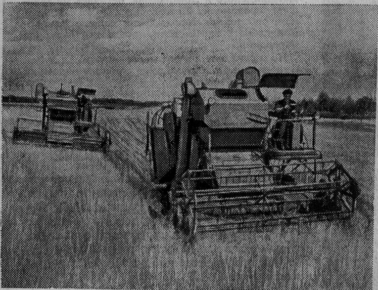
На колхозных и совхозных полях Латвии развернулись уборочные работы. Здесь под зерновые и зернобобовые занято 597 тысяч гектаров земли.