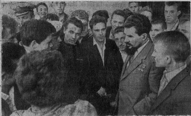
Призыв в Советскую Армию — волнующий праздник для каждого юноши. Коллективы заводов, фабрик, колхозов и совхозов устраивают торжественные вечера по случаю проводов молодежи в Вооруженные Силы.

НА СНИМКЕ: на вечере допризывников в Центральном Доме Советской Армии имени М. В. Фрунзе. Дважды Герой Советского Союза В. Н. Леонов беседует с молодежью.