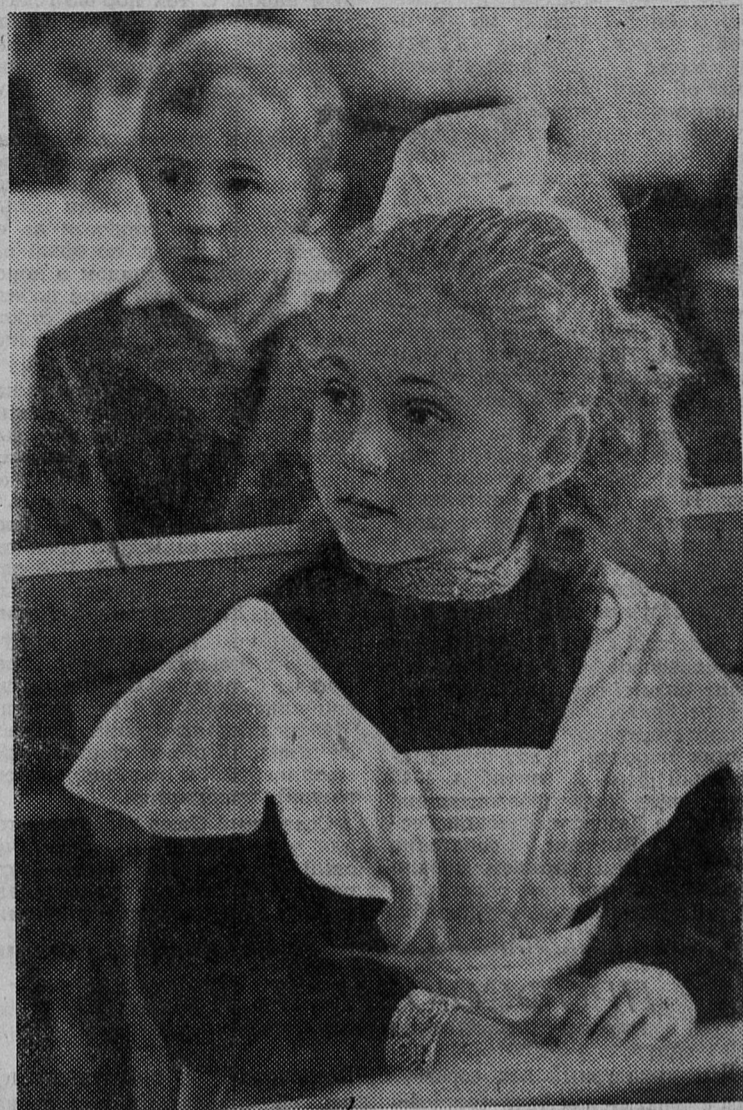
68 миллионов человек, почти треть часть населения нашей Родины, учится.

Таких показателей не знает ни одна капиталистическая страна.