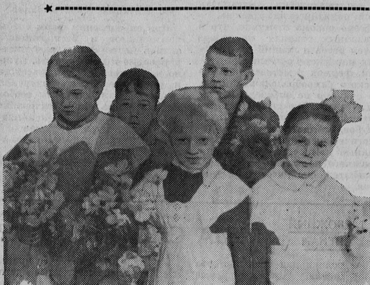
Первые цветы любимой учительнице.