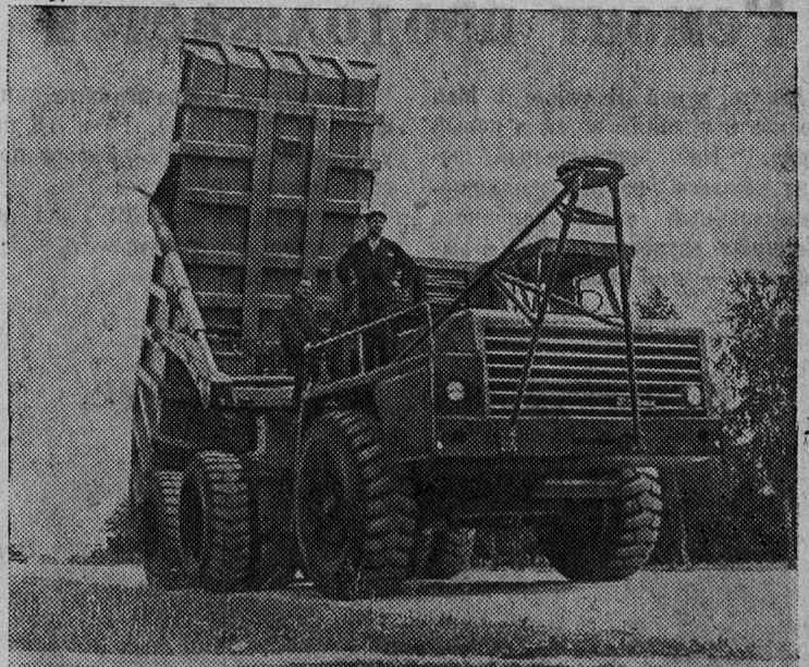
На Белорусском автомобильном заводе изготовлен опытный образец автопоезда-троллейвоза «Белаз-9524». Его грузоподъемность 65 тонн, скорость 50 километров в час.

Машина имеет четыре электромотора-колеса, которые получают электроэнергию со стороны через троллейное устройство, а также и от своего генератора, приводимого во вращение дизельным двигателем. Мощность одного электромотора-колеса — 200 киловатт. Автопоезда-троллейвозы найдут широкое применение в угольной и горнорудной промышленности.