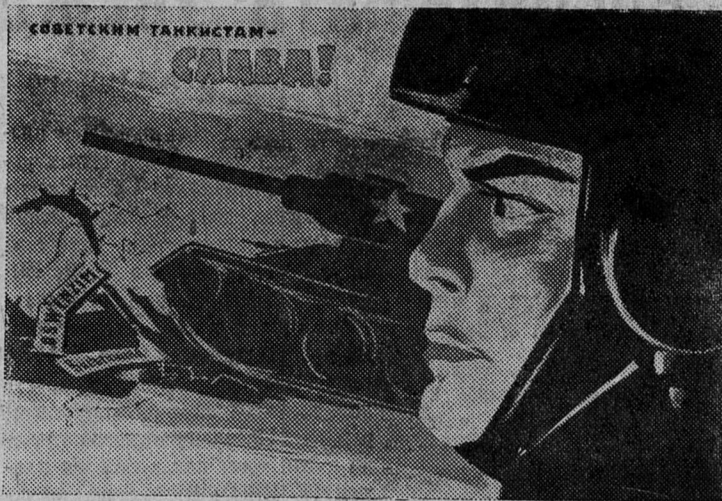
Плакат художника Б. Решетникова. (Издательство «Советский художник»).