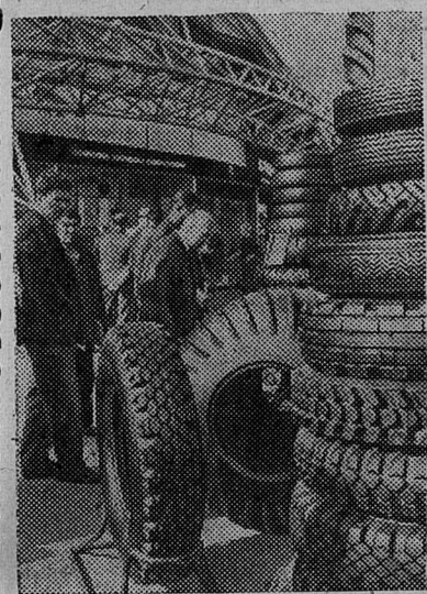
Москва. Международная выставка «Химия в промышленности, строительстве и сельском хозяйстве» в парке культуры и отдыха Сокольники.

На снимке: посетители знакомятся с автомобильными покрывками, выпускаемыми советской промышленностью. Здесь представлены автопокрывки для специальных машин, автомашин, работающих в заболоченных местах, песках, глубоком снегу, покрывки с цельным съемным протектором и со сменными протекторными кольцами и многие другие виды автомобильных покрывшек.