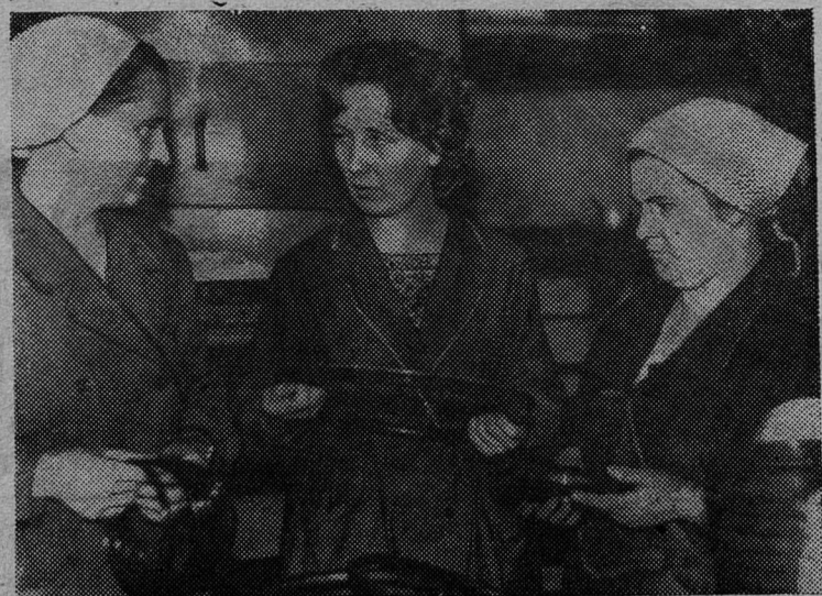
С каждым месяцем увеличивается ассортимент разнообразных резино-технических изделий на участке формовки Сланцевского регенератного завода.

Одновременно бюро горкома партии рекомендовало всем секретарям первичных партийных организаций предприятий, организаций и учреждений города усилить внимание к подписной кампании и добиться того, чтобы каждая семья получала в новом году газеты и журналы.