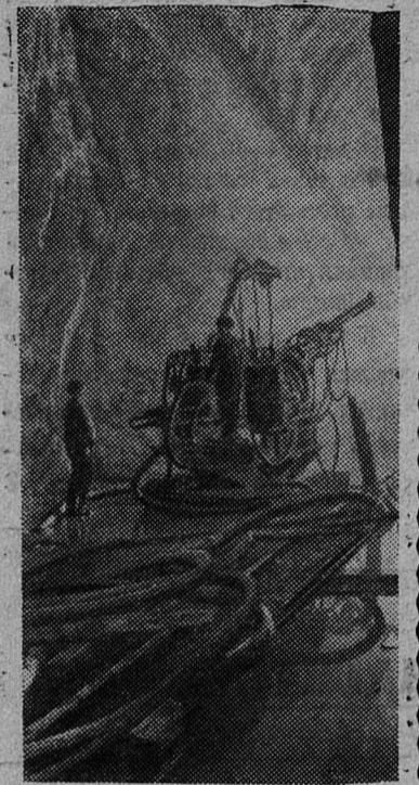
КИРГИЗСКАЯ ССР. В горах Тянь-Шаня, на реке Нарын, строится грандиозный энергетический комплекс — Токтогульская ГЭС. В узком и диком ущелье будет воздвигнута прочная железобетонная плотина высотой в 230 метров. В скальном зале длиной 120 метров, шириной 30 и высотой 60 метров строители установят шесть агрегатов мощностью 200 тысяч киловатт каждый.

НА СНИМКЕ: самоходная буровая установка на строительном искусственном русле реки.