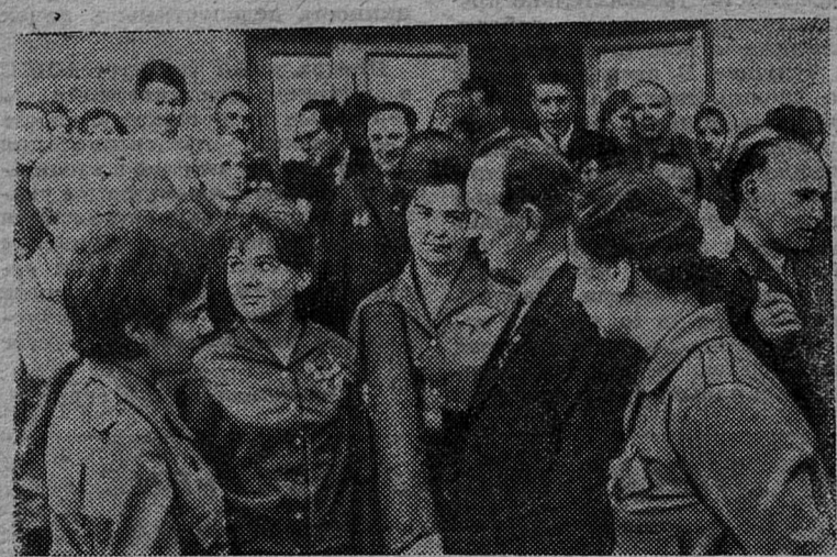
БРЕСТ. Всесоюзный слет победителей похода молодежи по местам боевой славы советского народа.

(Передовая «Правды» за 26 сентября с. г.)