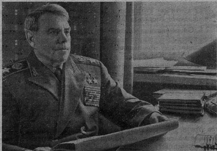
Завтра исполняется 70 лет со дня рождения крупнейшего военного деятеля, Маршала Советского Союза Александра Михайловича Василевского.

А. М. Василевский родился 30 сентября 1895 года, участник первой мировой и гражданской войн. В 1937 году окончил Академию Генерального штаба. В начале Великой Отечественной войны был заместителем начальника и начальником Генерального штаба. С 1942 года он первый заместитель Наркома обороны СССР, с февраля 1945 — командующий 3-м Белорусским фронтом, а с июня 1945 — главнокомандующий советскими войсками на Дальнем Востоке.