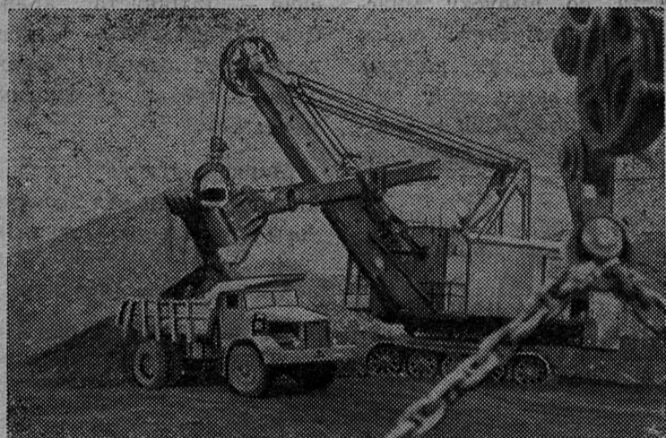
Коллектив крупнейшего в Кузнецком бассейне Красногорского угольного карьера досрочно вы-

полнил задание и сейчас трудится в счет будущей пятилетки.