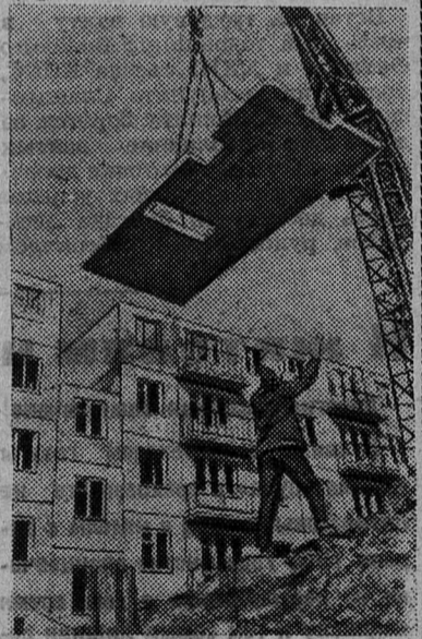
Сборка жилых домов в квартале № 36.

ПОНЕДЕЛЬНИК, 25 ОКТЯБРЯ 16.55 — Программа передач. 17.00 — Для дошкольников и младших школьников: «Умелые ручки». 17.30 — «Кривой Рог — Мансфельд». Передача из Днепропетровска (на Интерв.). 18.00 — Теленовости. 18.20 — Для юношества: «Искатели» (всесоюзный поиск по следам первых строителей Советской власти). 19.00 — Поет Леонардия Масленникова. 19.35 — «Мы не одиночки — мы — «Союз борьбы» (к 70-летию «Союза борьбы за освобождение рабочего класса»).