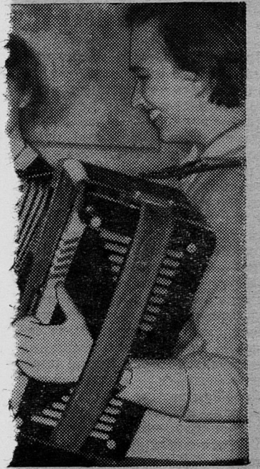
одые преподаватели Сланцев- му назад они сами были ее