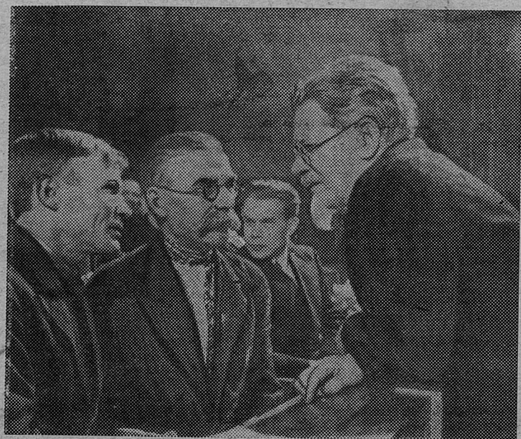
МОСКВА. IV сессия ВЦИК XVI созыва. НА СНИМКЕ: тов. М. И. Калинин перед началом заседания беседует с группой членов ВЦИК.

Самым трудным для молодой Советской республики был 1919 год. Страна пылала в огне гражданской войны. Свиристывали голод, разруха. В этих условиях исключительно важное значение приобретало упро-