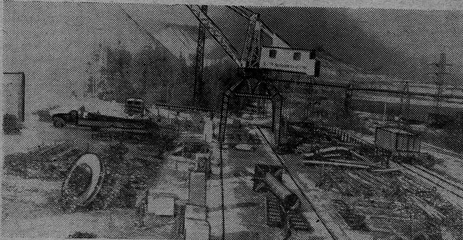
На снимке: общий вид монтажной площадки.

Еще совсем недавно здесь был лес, а теперь раскинулась новая монтажная площадка Северо-Западного управления треста «Коксохиммонтаж». На ней организованы сварочно-монтажные работы по изготовлению крупногабаритных металлоконструкций.