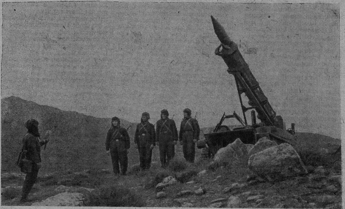
НА СНИМКЕ: командир ракетной установки ставит задачу расчету.