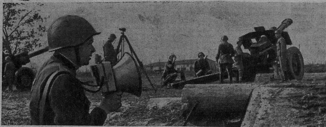
НА СНИМКЕ: подразделение тяжелых гаубиц на занятии.