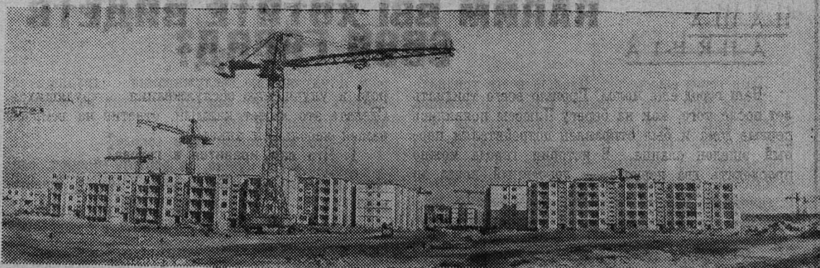
БАКУ. В северо-восточной части города ведется строительство нового жилого микрорайона. Детали зданий поставляет молодое предприятие республики — второй домостроительный комбинат. На снимке: строительство крупнопанельных домов в Восточном микрорайоне.