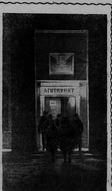
Ленинградская область. Приближается праздник советской демократии — выборы в местные Советы.

Регистрация кандидатов в депутаты городского Совета продолжается.