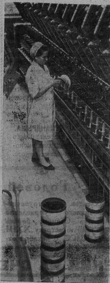
МОСКВА. Опытный завод Всесоюзного научно-исследовательского института стеклопластиков и стеклянного волокна изготовил