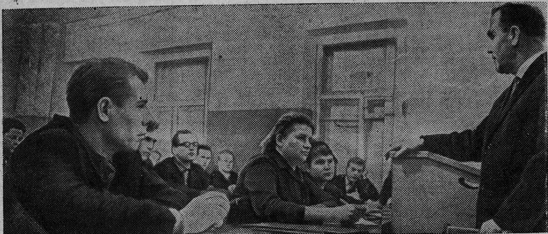
ЛЕНИНГРАД. В связи с решениями сентябрьского Пленума ЦК КПСС в Инженерно-экономическом институте имени Пальми-

ро Тольяти открыт новый факультет организаторов промышленного производства и строительства. Здесь занимаются руководя-