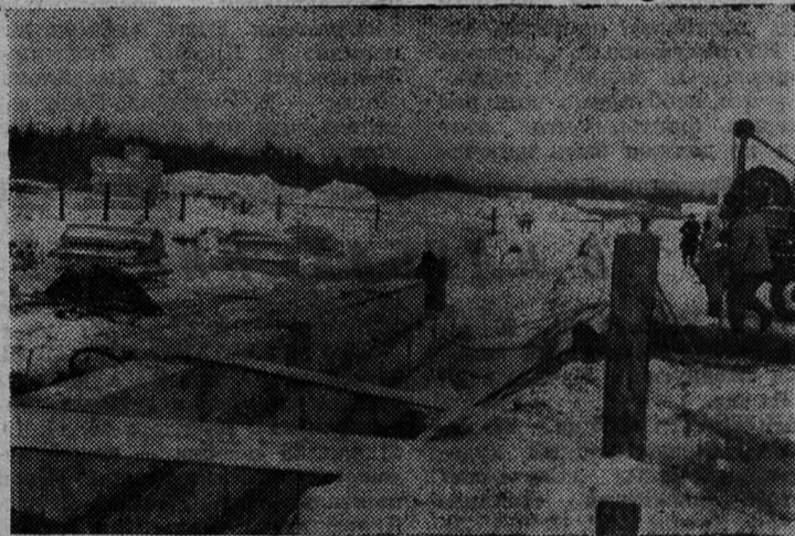
На центральной усадьбе совхоза «Сланцевский» — в деревне Гостицы приступили к строительству двух жилых домов. Сейчас здесь заканчиваются работы по закладке фундамента.