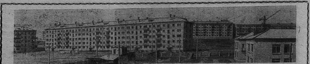
Новочебоксарск — восьмой по счету город Чувашии появился на карте республики. Он расположен на берегу Волги, где работает и продолжает строиться Чебоксарский химический комбинат. В новом городе более двадцати тысяч жителей.

(Материал подготовлен по просьбе нашей редакции ЛентАССом).