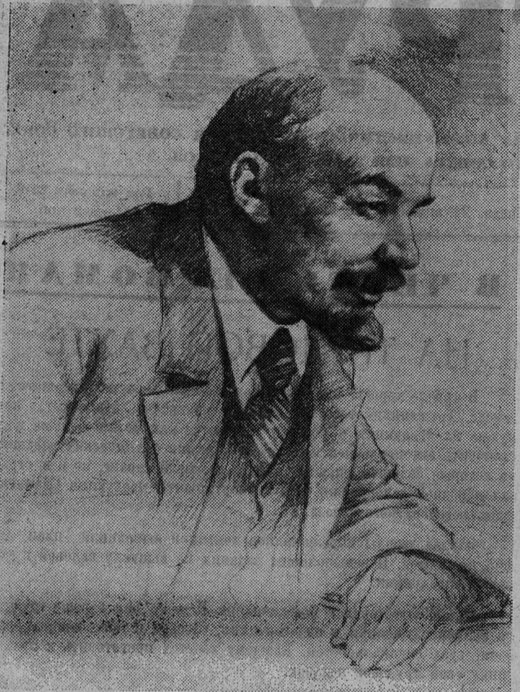
Владимир Ильич ЛЕНИН

Рисунок заслуженного деятеля искусств РСФСР П. Васильева.