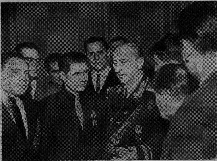
ЛЕНИНГРАД. Ленинградцы готовятся отметить 20-летие со Дня Победы советского народа над фашистской Германией. Во Дворце труда состоялся слет навалеров ордена Славы. На встречу с героями победоносных сражений пришли молодые рабочие, солдаты, офицеры и генералы Советской Армии.