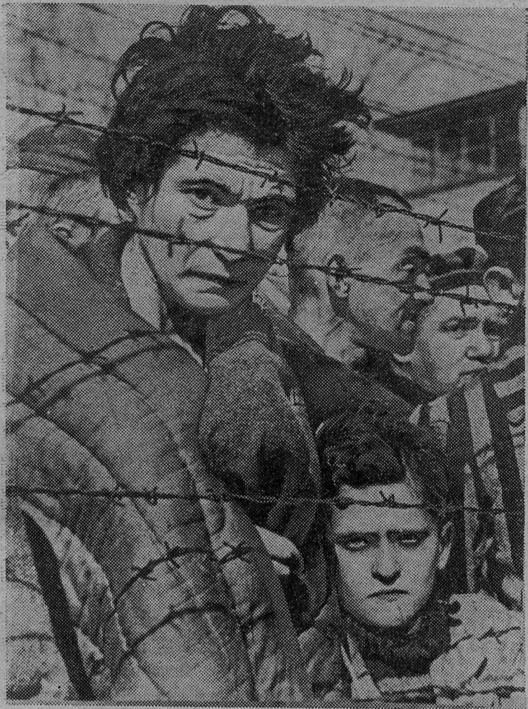
В. Юдин. «ОСВЕНЦИМ».