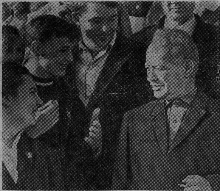
шеклассниками Ростова-на-Дону и Новочеркасска, молодыми колхозниками ряда районов Ростовской области. Между писателем и гостями велась оживленная беседа на волнующие молодежь темы. Момент этой встречи запечатлен на снимке.

Недавно Михаил Александрович встретился в станице с молодыми горянками Дагестана, которых пригласил в гости на Дон, стар-