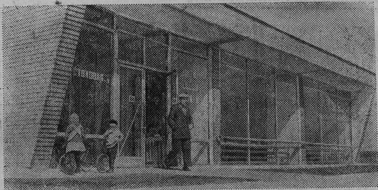
ЛЕНИНГРАД. Хороший подарок получили рабочие Подпорозжского завода мостовых железобетонных конструкций. Здесь недавно появилось новое, отлично оборудованное здание рабочей столовой.