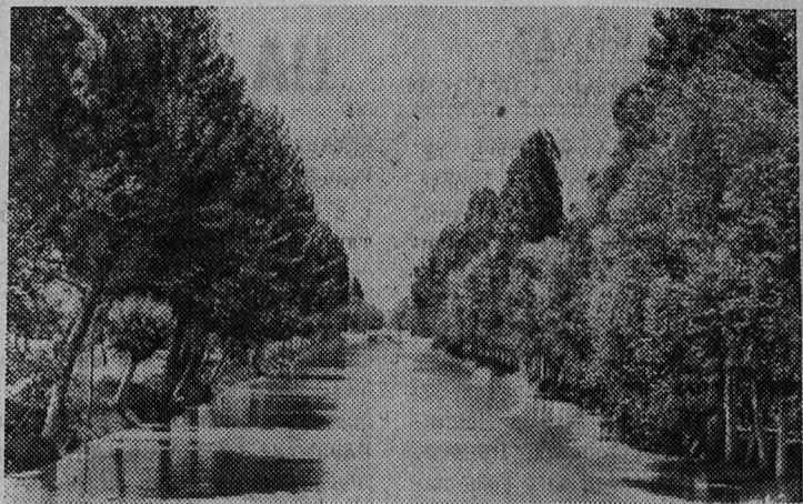
Большой Ферганский канал.