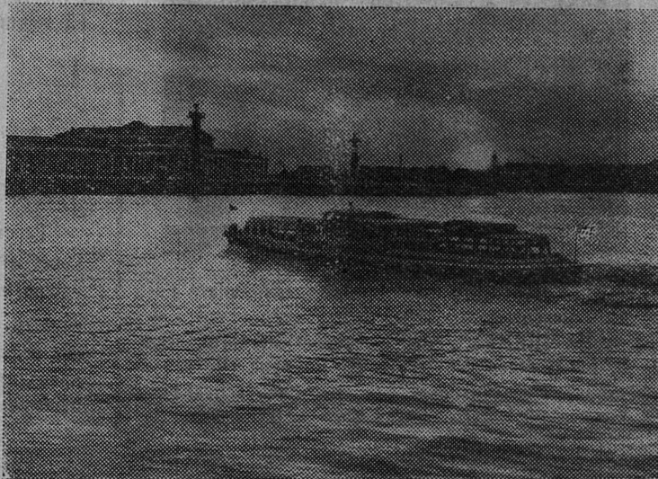
Фотоэтид. Белые ночи в Ленинграде.

Эти работы ведутся подрядной организацией РСУ-2 треста № 2 Ленсовнархоза, которая имеет только одну бригаду слесарей по прокладке наружного газопровода».