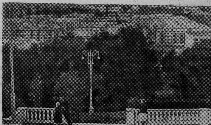
ЮЖНО-САХАЛИНСК. С горы Русской открывается чудесный вид на Южно-Сахалинские Черемушки.