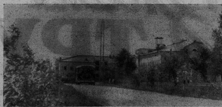
НА СНИМКЕ: улица Мира в поселке первой шахты.