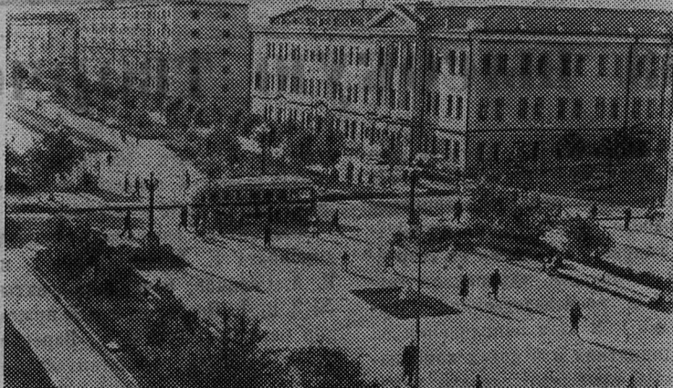
ИОШКАР-ОЛА. На проспекте Чавайна.

А. ХЛЮСТОВА, зав. городской библиотекой № 2.