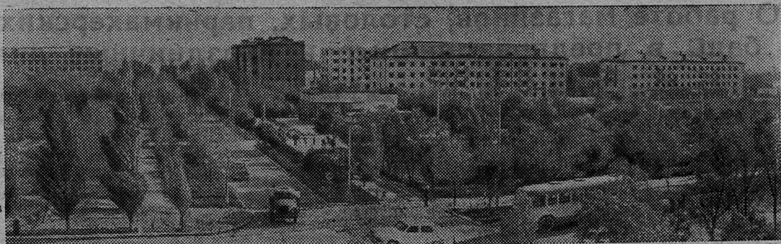
Сто лет исполняется с той поры, когда возникло небольшое селение там, где теперь находится столица Калмыкии. День ото дня Элиста раздвигает свои границы, становится наряднее. Только за последние годы строители республики сдали в эксплуатацию 70 тысяч квадратных метров жилой площади.

Р. МИКЕХИН, внештатный инструктор редакции.