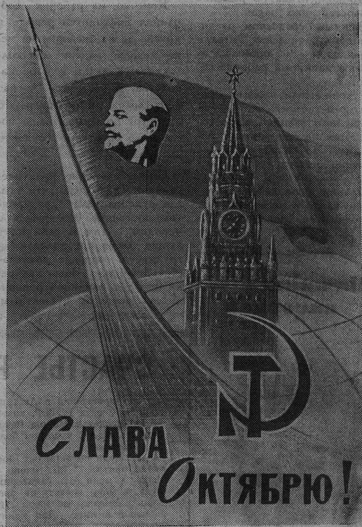
Плакат художника С. Новомлинского.

(Из Призывов ЦК КПСС к 48-й годовщине Великой Октябрьской социалистической революции)