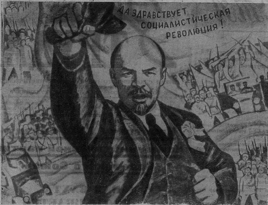
Плакат художника В. Каленского. (Издательство «Советский художник»).