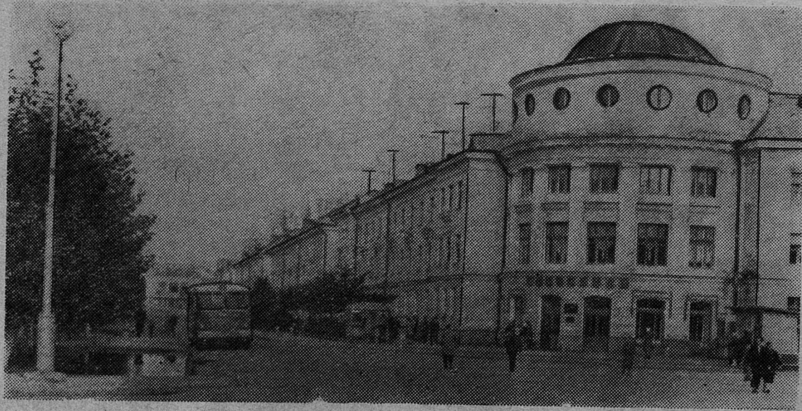
НА СНИМКЕ: вид улицы Маяковского.