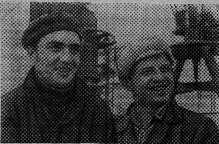
ДНЕПРОПЕТРОВСКАЯ ОБЛАСТЬ. Спорится дело у